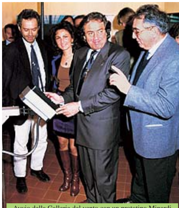
Avvio della Galleria del vento con un prototipo Minardi

World Championship. The role of Bonfiglioli Riduttori's has been to provide the link between the cultural and the sport-engineering realities. This initiative has led the museum to receive even more interest, especially from young people, who are allowed to admire up close and actually "touch" an authentic Formula 1 auto. This event is the result of the determination of business and cultural entities to carry on the dialogue with young people and to have them