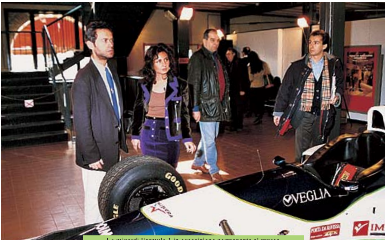
La minardi Formula 1 in esposizione permanente al museo